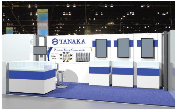
<出展ブースイメージ図>

独自技術による極細線コイリング材をはじめ、 センサ・電極など様々な用途に対応可能な貴金属材料を展示