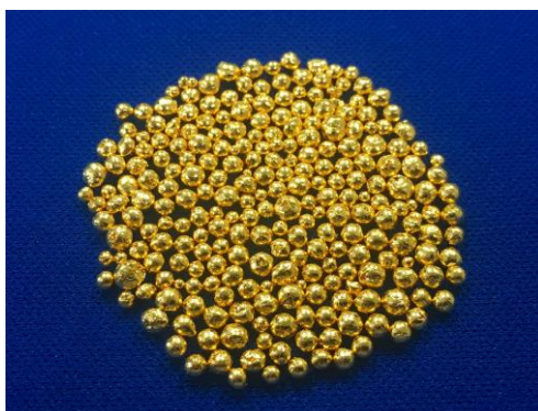
【高品質 Au 蒸鍍材料「SJeva」（粒狀）】

由於本蒸鍍材料具有上述特色及優點，對於半導體領域中的細微佈線、MEMS 或光學裝置（Optical device）、LED、醫療儀器等使用蒸鍍材料製造的最終成品，可望提升終端用客戶的生產性及有助於縮減成本。