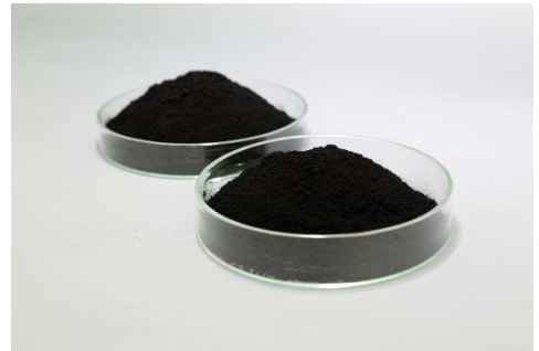
<PEFC 용 전극 촉매>

현재, 다나카귀금속공업의 쇼난 공장내의 FC 촉매 개발센터에서는 고체 고분자형 연료전지(이하 PEFC)의 전극 촉매를 개발, 제조하고 있습니다. PEFC 는 연료전지 자동차(이하 FCV)나 가정용 연료전지 ‘에네팜’ 등에서 사용되고 있으며, 나아가 앞으로는 FC 버스 등의 상용차나 FC 지게차 등의 산업 기계 분야에서도 사용 확대가 기대되고 있습니다. PEFC 는 소형 경량으로 고효율을 발휘할 수 있으며, 수소와 산소의 화학 반응을 이용한 지구에 부담이 없는 새로운 에너지 기술입니다. 다나카귀금속공업에서는 오랜 세월 키워온 귀금속 촉매 기술 및 전기화학 기술을 집결해 PEFC 의 캐소드(공기극)용으로 고효율인 백금 촉매를, 애노드(연료극)용으로 내일산화탄소(CO) 피독 특성이 뛰어난 백금 합금 촉매를 개발하고 있습니다.